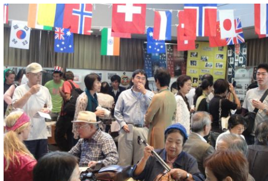
国際喫茶は満員御礼