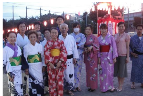
潮田西部地区盆踊り大会