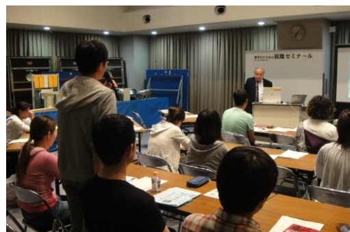
留学生のための就職ゼミナール