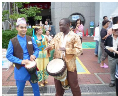
エントランスでステージの宣伝