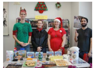
鶴見国際交流ラウンジオープン

その他、12月4日の鶴見国際交流ラウンジオープン(参加者2,100人)の際は、ステージでネパールと中国ウィグルのダンスを披露し、アメリカ、韓国、中国のブースにおいて世界のお茶とお菓子を提供しました。