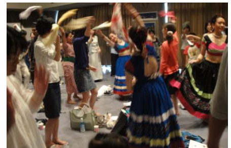
ネパールの音楽と踊りの集い