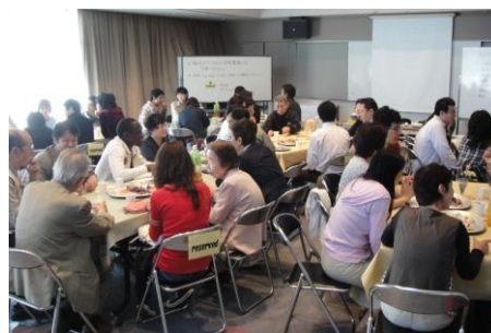
チュータープログラム説明・交流会