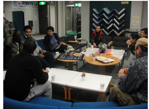
コミュニケーションタイム

実施日：7月10日(土) 会場：国際学生会館 参加者：講座/30人、総会/72人