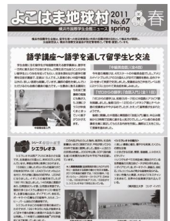
ニュースレター 「よこはま地球村」

発行：年4回(6月夏号、9月秋号、12月冬号、3月春号) 体裁：A3二つ折一色刷 発行部数：4,000部